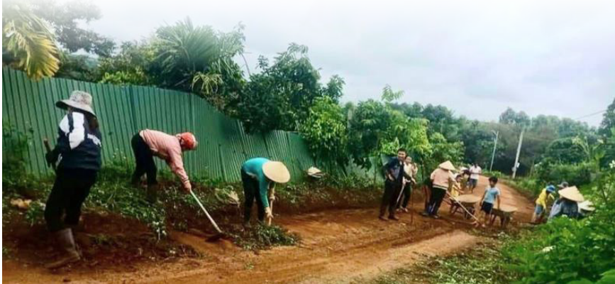
Nhân dân xã Hoài Đức tham gia hoạt động “Ngày Chủ nhật vì cộng đồng”

“Ngày Chủ nhật vì cộng đồng” được tổ chức với mục đích kêu gọi và khuyến khích toàn dân tổ chức, tham gia những hoạt động vì cộng đồng góp phần kết nối, lan tỏa tình yêu thương và trách nhiệm với cộng đồng; phát huy sức mạnh tổng hợp, tăng cường sự đoàn kết, gắn bó giữa cán bộ, đảng viên với Nhân dân, chung tay hướng về địa phương, cơ sở; xây dựng đời sống văn hóa, tôn tạo cảnh quan, môi trường ở cơ quan, đơn vị, địa phương, khu dân cư “Sáng - xanh - sạch - đẹp”.