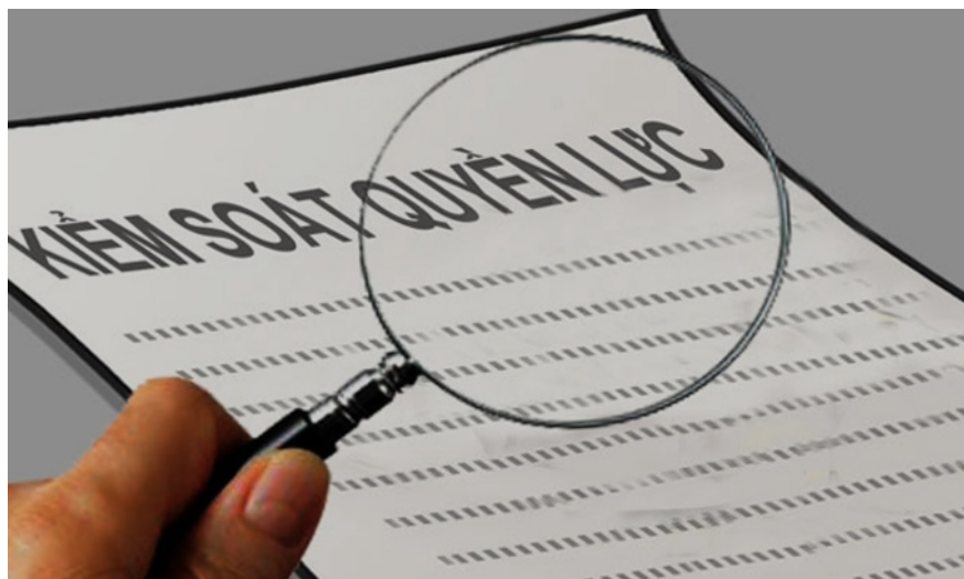
Hình minh họa

Quyết định đầu tư chương trình, dự án có sử dụng vốn ngân sách không đúng thẩm quyền, không xác định rõ nguồn vốn để thực hiện. Thực hiện vay trái với quy định của pháp luật; vay vượt quá khả năng cân đối của ngân sách. Sử dụng ngân sách nhà nước để cho vay, tạm ứng, góp vốn trái với quy định của pháp luật. Trì hoãn việc chi ngân sách khi đã bảo đảm các điều kiện chi