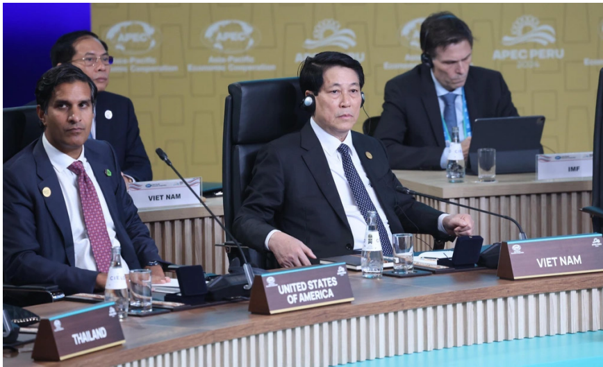
Chủ tịch nước Lương Cường dự Hội nghị Cấp cao APEC lần thứ 31.

lĩnh vực khác nhau của xã hội, thúc đẩy kết nối, hòa nhập và đảm bảo tính bền vững lâu dài; đổi mới và số hóa để thúc đẩy quá trình chuyển đổi nền kinh tế; Tăng trưởng bền vững bao gồm thúc đẩy quá trình chuyển đổi năng lượng và tăng cường an ninh lương thực để xây dựng khả năng phục hồi cũng như ứng phó với biến đổi khí hậu và các thách thức khác.