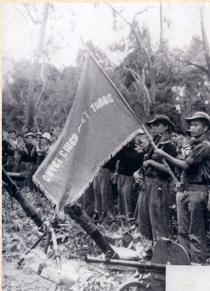
Tặng thưởng cờ Quyết chiến quyết thắng cho đơn vị chiến thắng Bình Giã.

Về phía ta, chấp hành chỉ thị của Quân uỷ Trung ương, Bộ Tổng tư lệnh và phương hướng hoạt động tác chiến Đông Xuân 1964 - 1965, đầu tháng 11/1964, Bộ Chỉ huy Miền quyết định mở chiến dịch tiến công địch tại khu vực Bình Giã - Đức Thanh - Đường số 2, trên địa bàn các tỉnh Bà Rịa, Long Khánh, Biên Hoà, Bình Thuận (nay thuộc tỉnh Bà Rịa - Vũng Tàu, Đồng Nai và nam tỉnh Bình Thuận), trong đó xác định hướng chủ yếu là Bà Rịa - Long Khánh, hướng phối hợp là Nhơn Trạch, Long Thành (Biên Hoà) và Hoài Đức, Tân Linh (Bình Thuận) nhằm tiêu diệt