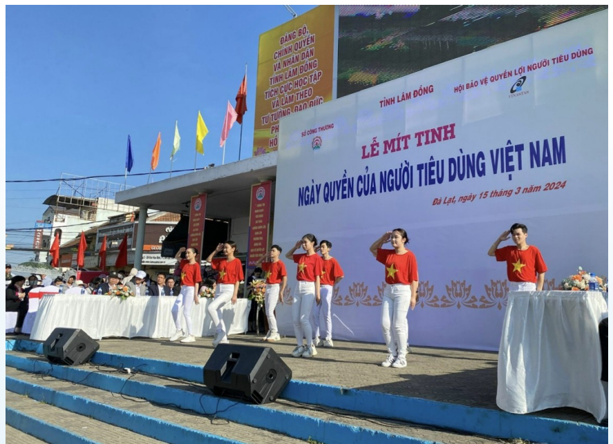
Lâm Đồng tổ chức Lễ mít tinh Ngày Quyền của người tiêu dùng Việt Nam năm 2024.

Thực hiện chỉ đạo của Tỉnh ủy, UBND tỉnh, các cấp ủy, chính quyền, Mặt trận Tổ