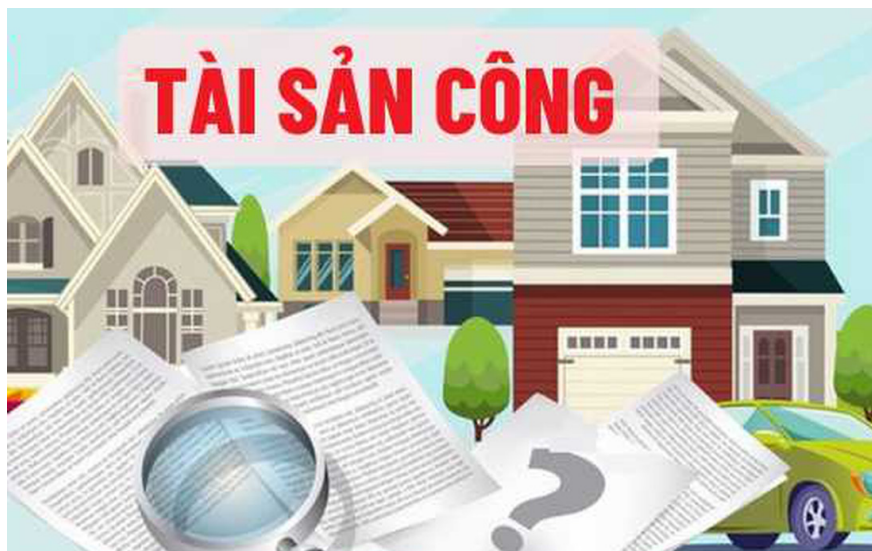
Hình minh họa

Tổ chức xã hội, tổ chức xã hội nghề nghiệp, tổ chức khác được thành lập theo quy định của pháp luật về hội tự đảm bảo tài sản để phục vụ hoạt động. Nhà nước chỉ hỗ trợ kinh phí