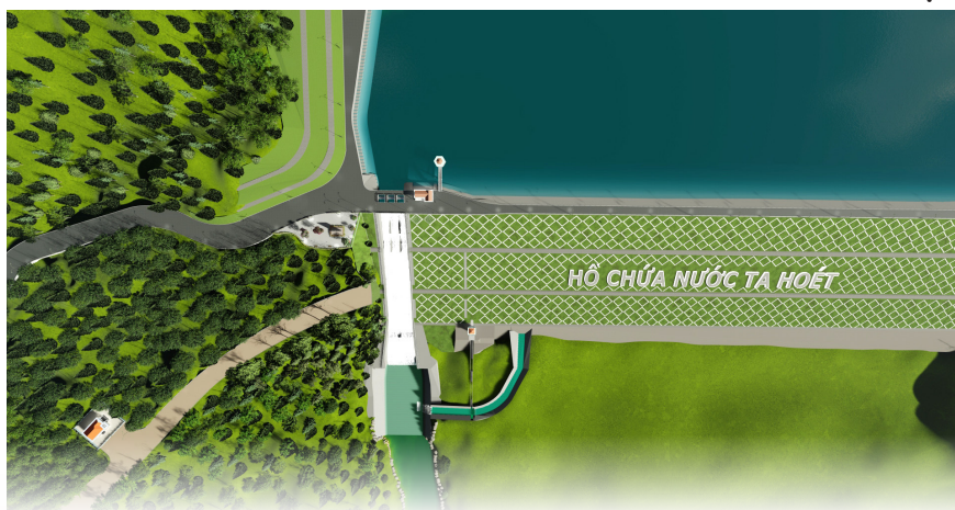
Phối cảnh Hồ chứa nước Ta Hoét.

Ban Biên tập Bản tin nội bộ cung cấp tài liệu tuyên truyền Dự án xây dựng hồ chứa nước Ta Hoét, huyện Đức Trọng do Sở Nông nghiệp và Phát triển Nông thôn tỉnh biên soạn để các cơ quan, đơn vị làm căn cứ tổ chức tuyên truyền rộng rãi, vận động, tạo sự đồng thuận trong các tầng lớp Nhân dân chấp hành chủ trương của Đảng, chính sách, pháp luật của Nhà nước về dự án.