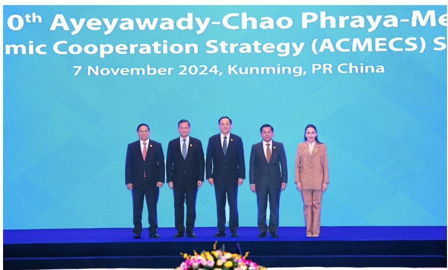
Thủ tướng Phạm Minh Chính và các trưởng đoàn tham dự Hội nghị cấp cao Chiến lược hợp tác kinh tế Ayeyawady-Chao Phraya-Mê Công (ACMECS) lần thứ 10.

Theo công bố kết quả bầu cử, ông Donald Trump đã giành chiến thắng với 312 phiếu đại cử tri, trong khi ứng cử viên đảng Dân chủ Kamala Harris nhận được 226 phiếu đại cử tri. Theo luật định, một ứng cử viên cần nhận tối thiểu 270 phiếu