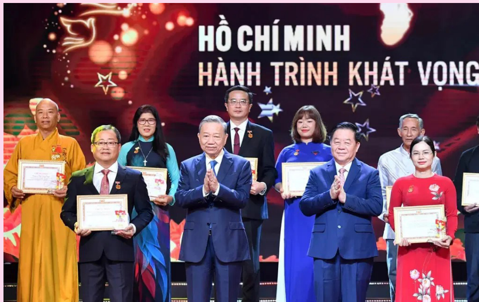
Tổng Bí thư Tô Lâm và Ủy viên Bộ Chính trị, Bí thư Trung ương Đảng, Trưởng Ban Tuyên giáo Trung ương Nguyễn Trọng Nghĩa trao Chứng nhận và Biểu trưng tôn vinh điển hình tiêu biểu.

Phát biểu tại chương trình, Tổng Bí thư Tô Lâm bày tỏ xúc động đến dự chương trình “Hồ Chí Minh - Hành trình khát vọng 2024” - một chương trình rất ý nghĩa, gặp mặt, tôn vinh các điển hình tiêu biểu toàn quốc, góp phần lan tỏa, truyền cảm hứng, tạo khí thế, thúc đẩy phong trào thi đua sôi nổi trong cả nước về học tập và làm theo tư tưởng, đạo đức, phong cách Hồ Chí Minh. Tổng Bí thư nhấn mạnh: Gần 95 năm qua, tư tưởng Hồ Chí Minh cùng với Chủ nghĩa Mác-Lênin đã trở thành ngọn đuốc soi đường, đưa cách mạng Việt Nam dưới sự lãnh đạo của Đảng vượt mọi thác ghềnh, giành hết thắng lợi này đến thắng lợi khác, lập nên nhiều kỳ tích. Trong chương trình hôm nay, có rất nhiều câu chuyện sâu sắc, những điển hình tiêu biểu của phong trào học và làm theo Bác, với