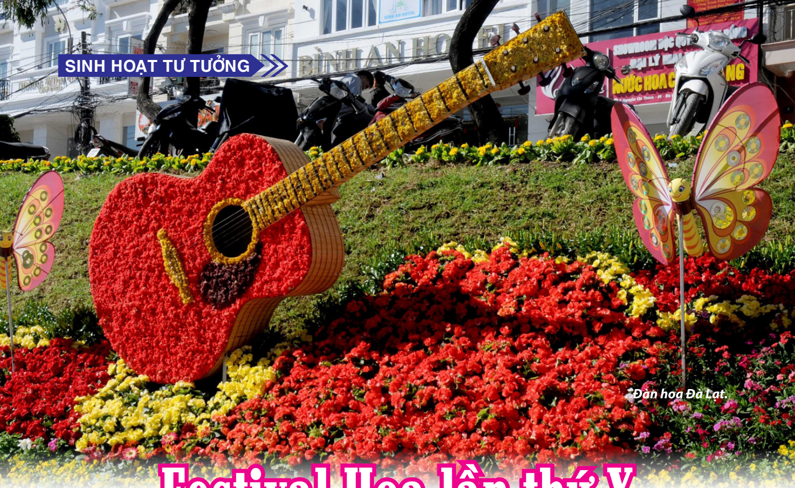
Đàn hoa Đà Lạt.