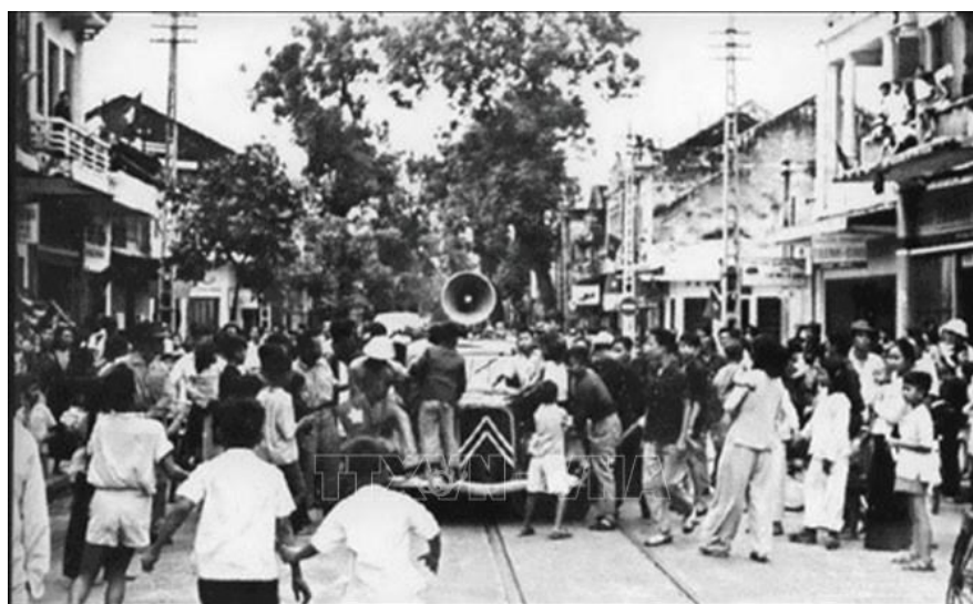
Phát lệnh toàn quốc kháng chiến ở Hà Nội, tháng 12/1946.

Lời kêu gọi Toàn quốc kháng chiến của Chủ tịch Hồ Chí Minh cùng với Chỉ thị Toàn dân kháng chiến của Ban Thường vụ Trung ương Đảng và tác phẩm Kháng chiến nhất định thắng lợi của Tổng Bí thư Trường Chinh đã xác lập đường lối kháng chiến toàn dân, toàn diện, trường kỳ và dựa vào sức mình là chính ; trở thành ánh sáng soi đường cho dân tộc ta đi đến thắng lợi trong cuộc kháng chiến chống thực dân Pháp xâm lược.