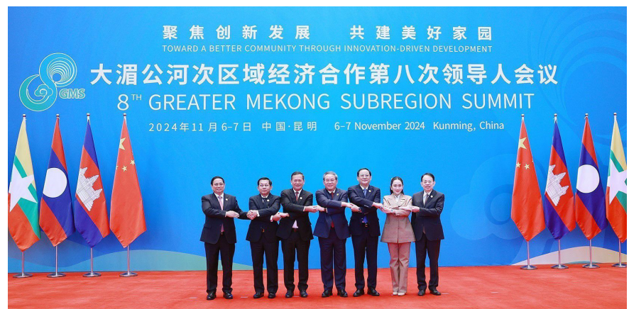
Thủ tướng Trung Quốc Lý Cường đón Thủ tướng Phạm Minh Chính và các trưởng đoàn tham dự Hội nghị thượng đỉnh Hợp tác Tiểu vùng Mê Công mở rộng (GMS) lần thứ 8.

như xuất phát từ nhu cầu bảo vệ dòng sông chung Mekong quý giá, các nước tái khẳng định cam kết trong hợp tác về quản lý và sử dụng bền vững nguồn nước sông Mekong, ứng phó biến đổi khí hậu, chuyển đổi năng lượng xanh, sạch, xây dựng các nền kinh tế xanh - tuần hoàn; (2) Tăng cường sức mạnh nội tại của các nền kinh tế. Với mục tiêu nâng cao tiềm lực và năng lực của các nền kinh tế, các khuôn khổ hợp tác GMS, ACMECS, CLMV cần ưu tiên thúc đẩy công nghiệp