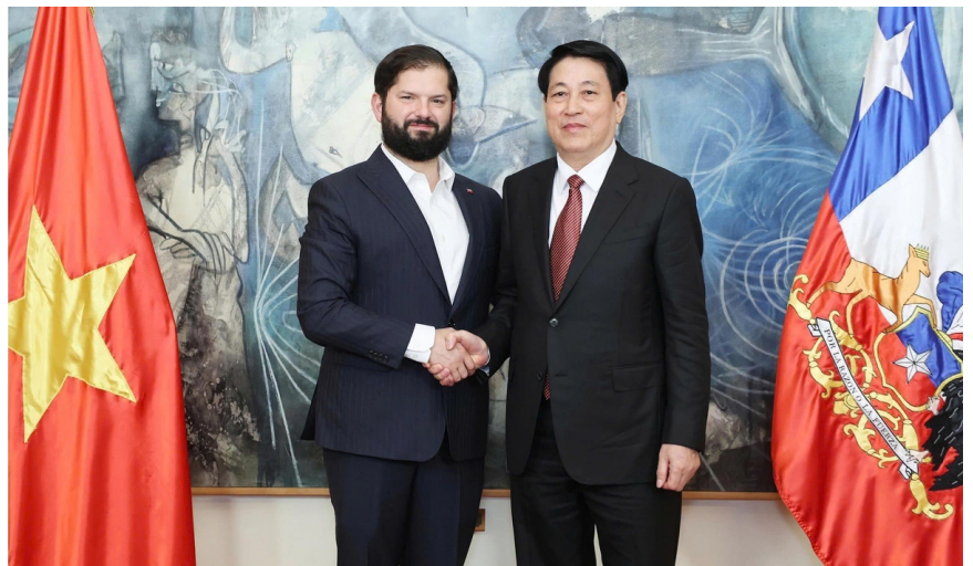
Chủ tịch nước Lương Cường và Tổng thống Chile Gabriel Boric Font chụp ảnh chung trước hội đàm.

các nguyên tắc, quan điểm nhất quán, xuyên suốt về độc lập, tự chủ, tự lực, tự cường, đa phương hóa, đa dạng hóa, vì hòa bình, hợp tác và phát triển. Việt Nam ủng hộ hệ thống thương mại đa phương và vai trò trung tâm của Tổ chức Thương mại thế giới; tin tưởng vào giá trị của tự do thương mại, kết nối và hội nhập quốc tế; sẽ tham gia có trách nhiệm và đóng góp tích cực vào nền chính trị thế giới, kinh tế toàn cầu và văn minh nhân loại trên tinh thần là bạn, là đối tác tin cậy và là thành viên tích cực, có trách nhiệm trong cộng đồng quốc tế.