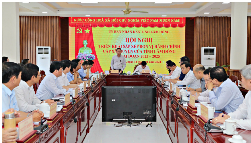
Quang cảnh hội nghị.

Đồng thời, chuẩn bị đầy đủ cơ sở vật chất, trang thiết bị, bố trí nơi làm việc để đảm bảo phục vụ tổ chức bộ máy của UBND huyện Đa Huoai, UBND các xã có liên quan đến sắp xếp đơn vị hành chính đi vào hoạt động ngay sau khi thành