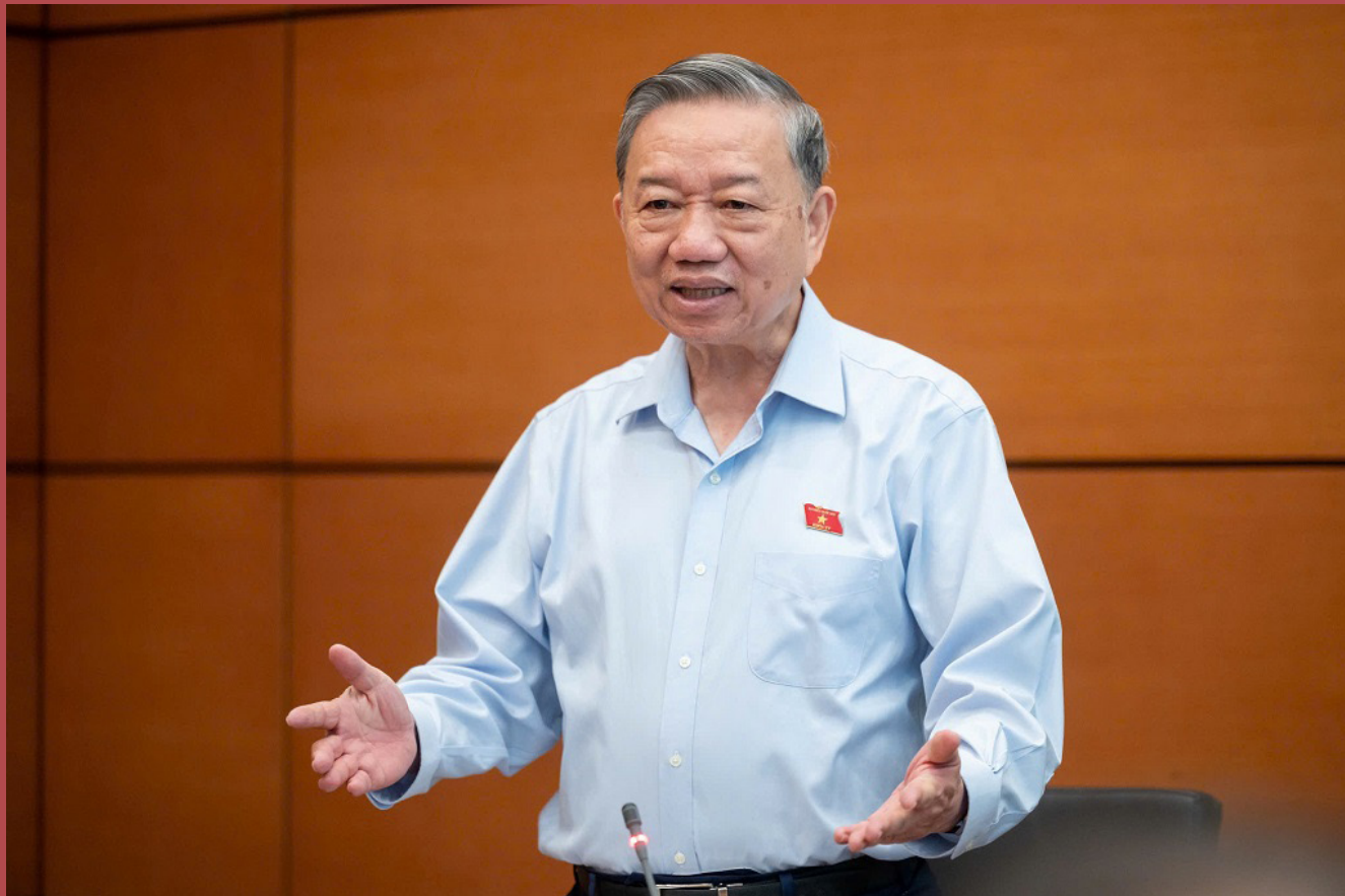
Tổng Bí thư Tô Lâm.

Trong bài viết “TINH - GỌN - MẠNH - HIỆU NĂNG - HIỆU LỰC - HIỆU QUẢ” ngày 5/11/2024 của Tổng Bí thư Tô Lâm chuyển tải thông điệp mạnh mẽ về sự cần thiết và cấp bách của việc sắp xếp, tinh gọn bộ máy hệ thống chính trị (HTCT).