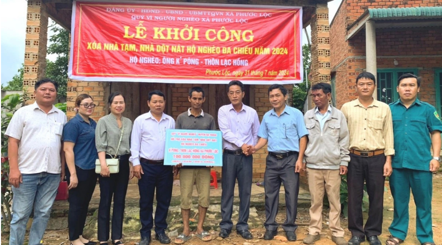
Khởi công xóa nhà tạm, nhà dột nát cho hộ nghèo ở xã Phước Lộc, huyện Đạ Huoai.

Đảng đoàn Ủy ban MTTQ Việt Nam, các tổ chức chính trị - xã hội tỉnh, Ban Thường vụ Tỉnh đoàn cần đẩy mạnh tuyên truyền, vận động cán