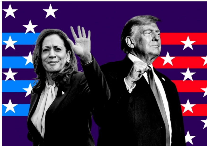
Bà Harris và ông Trump.

Nhiều nước đã chúc mừng Tổng thống đắc cử Mỹ Donald Trump đồng thời bày tỏ mong muốn tiếp tục tăng cường hơn nữa quan hệ với Mỹ. Đáng chú ý, ngày 08/11/2024, người phát ngôn Điện Kremlin Dmitry Peskov cho biết, Tổng thống Liên bang Nga Vladimir Putin đã chúc mừng ông Donald Trump về chiến thắng trong cuộc bầu cử tổng thống Mỹ, ca ngợi ông Trump vì sự dũng cảm khi đối mặt với một kẻ tấn công có vũ trang và nói rằng Nga sẵn sàng đối thoại với Tổng thống Donald Trump. Theo người phát ngôn Điện Kremlin, Tổng thống Putin đã nhiều lần tuyên bố sẵn sàng đối thoại với tất cả các bên quan tâm và với những người có thể đóng góp vào việc giải quyết xung đột ở Ukraine. Trong bài phát biểu đêm 06/11/2024, Tổng thống Ukraine Volodymyr Zelensky chúc mừng chiến thắng của ông Trump, cho rằng kết quả bầu cử Mỹ là hoàn toàn thuyết phục. Ông Zelensky nhấn mạnh, đối với Ukraine, điều vô cùng quan trọng là “hòa bình thông qua sức mạnh”, đồng thời mong muốn điều này trở thành nguyên tắc trong chính sách của tân Tổng thống Hoa Kỳ.