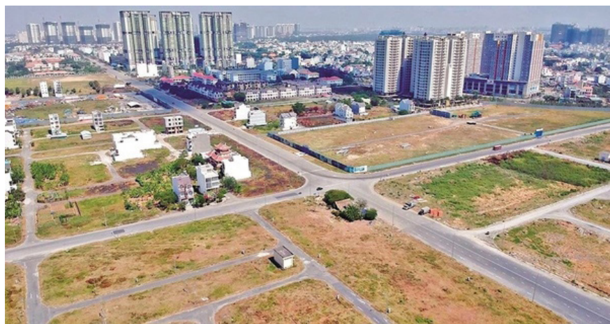
Ảnh minh họa.

Theo đó, Thường trực Tỉnh ủy yêu cầu các cấp ủy, tổ chức đảng quán triệt phương châm “Đảng lãnh đạo, Nhà nước quản lý, Mặt trận Tổ quốc và các đoàn thể hỗ trợ, Nhân dân làm chủ”; quyết tâm cao, nỗ lực lớn, hành động quyết liệt, đẩy nhanh triển khai xóa nhà tạm, nhà dột nát trên địa bàn tỉnh. Tập trung lãnh đạo, chỉ đạo, phát huy vai trò, trách nhiệm của người đứng