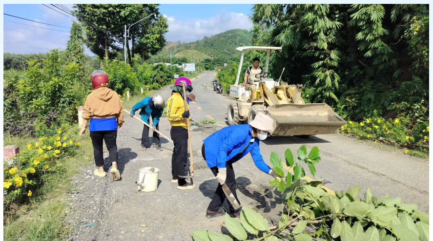
Đoàn xã Quốc Oai tổ chức sửa chữa các vị trí đường bị hư hỏng từ thôn Hà Mỹ tới thôn Hà Lâm.

Bên cạnh đó, Đảng ủy xã đã triển khai cho 100% các đồng chí cán bộ, đảng viên đăng ký nội dung học tập theo chuyên đề phù hợp với vị trí công việc, nhiệm vụ chi bộ, thủ trưởng cơ quan phân công để làm cơ sở đánh giá, xếp loại đảng viên cuối năm. Đồng thời, chỉ đạo Mặt trận Tổ quốc, các đoàn thể tăng cường công tác vận động Nhân dân tích cực tham gia các phong trào thi đua yêu nước tại địa phương, đặc biệt quan tâm đến xây dựng nông thôn mới về cảnh quan môi trường, Khu dân cư kiểu mẫu; chỉ đạo khối dân