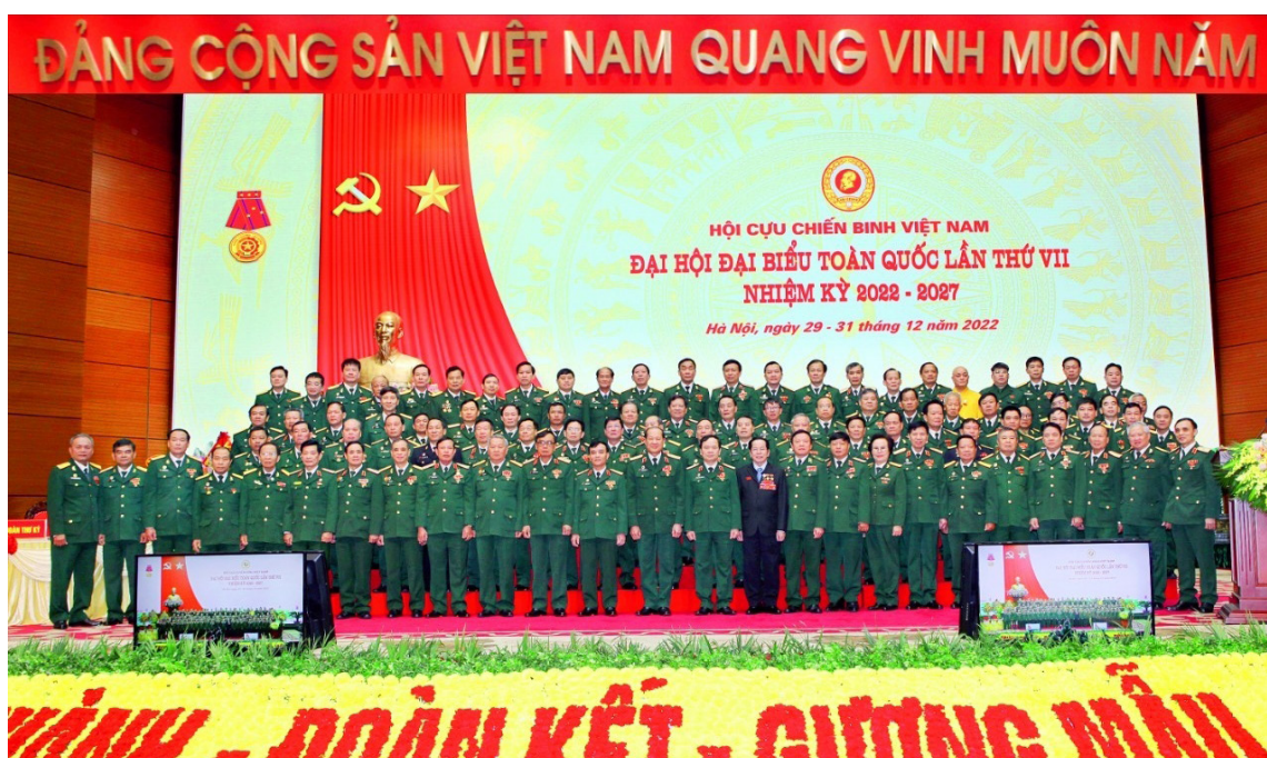
Ban Chấp hành Trung ương Hội Cựu chiến binh Việt Nam khóa VII, nhiệm kỳ 2022-2027.

Cựu chiến binh là những người đã trải qua chiến đấu, rèn luyện và trưởng thành qua khói lửa của các cuộc kháng chiến, đã có những cống hiến to lớn cho sự nghiệp đấu tranh giải phóng dân tộc, xây dựng và bảo vệ Tổ quốc, ngày nay đang là một bộ phận rất quan trọng của xã hội.